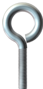
Armella de andamio M8 x 40 mm